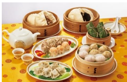
※写真はイメージです。

120 余年進化し続ける中国料理をお届けする萬珍樓が新登場。こだわりの食材を磨き上げた調理法で中国広東料理に昇華しました。