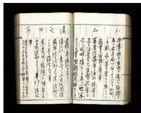
「備忘録」明治 43 年

神奈川県産豚肉を使用し、明治 43 年の「備忘録」に記された当時のレシピをもとに、ブランデー入り（アルコール分加熱処理済）の調味液にしっかり漬け込みました。