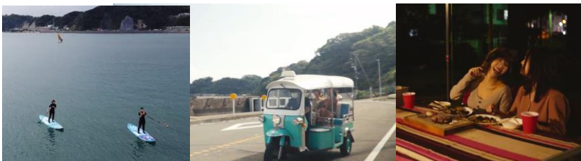
「三浦Cocoon」で体験できるアクティビティのイメージ

同時にscheme vergeが提供するアートを切り口とした観光型MaaSアプリ「Horai」でも,三浦半島にサービスエリアを拡大し,AIによる複数のモビリティを活用したモデルコース作成などを開始いたします。詳細は別紙のとおりです。