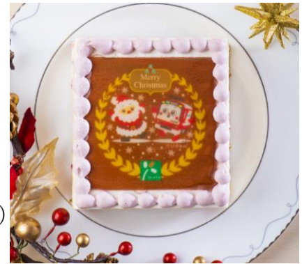
「けいきゅんクリスマスケーキ」