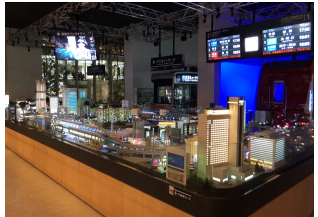
夜の「京急ミュージアム」