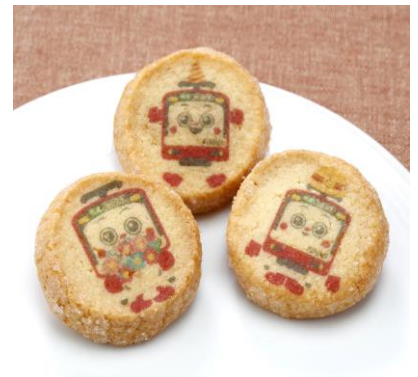
「けいきゅんアニバーサリークッキー」