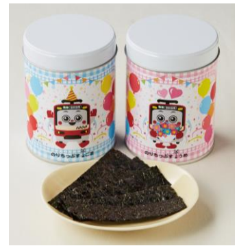
「のりちっぷす（うめ・ごま）」