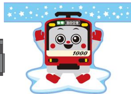
「けいきゅん号」内 中吊りポスターイメージ