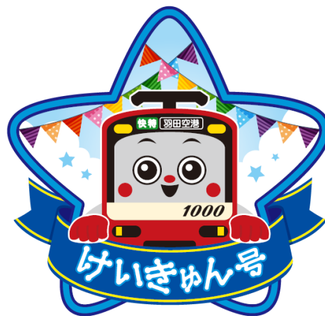
オリジナルヘッドマーク

今年の「けいきゅん号」は、「けいきゅん」と「星」をモチーフにしたデザインとなっており、車体だけではなく、車内の窓上ポスター、つり革など、車両全体がオリジナルデザインで施されています。また中吊りポスターは、「けいきゅん」の形を型取っためずらしいデザインを掲出いたします。さらに正面には、9回目の誕生日を記念した星形のオリジナルヘッドマークを付けて運行いたします。