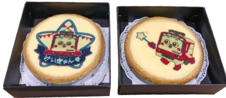
「けいきゅんケーキ」