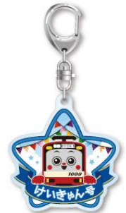
アクリルキーホルダー