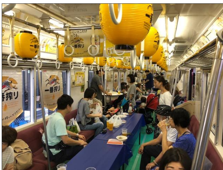
一昨年のイベントの様子