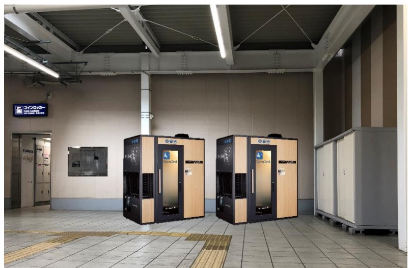
京急川崎駅設置場所・設置イメージ