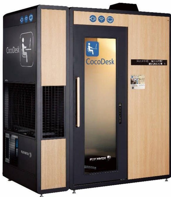
ワークスペース「CocoDesk」外観

京急電鉄は，2020年7月20日のダイヤ一部変更にて，朝のラッシュピーク後の快特上下各1本の車両数を8両から12両に増やすなど，混雑緩和・オフピーク通勤の促進をおこなっております。“With コロナ”時代のニューノーマルにおいても，少しでも安心して鉄道をご利用いただけるような取り組みを進めてまいります。詳細は別紙のとおりです。