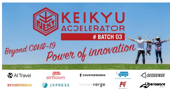
第3期メインビジュアル

「モビリティを軸とした豊かなライフスタイルの創出」を目指し、スタートアップ企業とのオープンイノベーションにより新規事業創出を目指すプログラム。これまで12社を採択し、京急グループと8件のテストマーケティング（実証実験）を実行しています。第3期となる今期は、「Mobility」「Living」「Working」「Retail」「Entertainment」「Connectivity」の6つのテーマ領域を設定し、6月に参加企業10社の発表をおこないました。本プログラムの参加企業は、京急グループの事業基盤を活用したテストマーケティングを行いながら事業共創を図り、デジタル・テクノロジーを積極的に活用した、“with コロナ”、“after コロナ”時代の新たなモビリティとライフスタイルを生み出すイノベーションの創出を目指します。