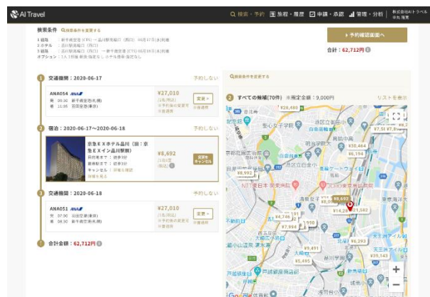
「AI Travel」予約画面（イメージ）