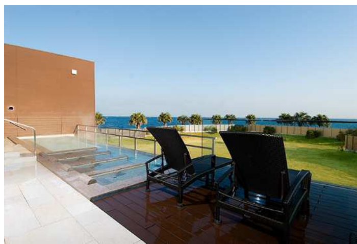
観音崎京急ホテル SPASSO