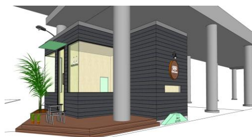
スケートボードショップイメージ