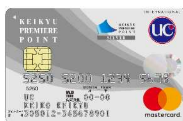
京急プレミアムポイント シルバー