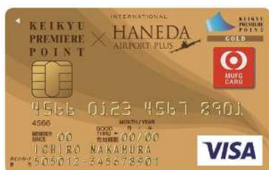
京急プレミアムポイントゴールド HANEDA

京急沿線にお住まいのお客さまに大変便利でお得なカードです。京急プレミアムポイント加盟店にてお買い上げいただくと基本ポイントとクレジットポイントが貯まる、ポイントカード一体型のクレジットカードです。なお、同カードで京急線鉄道定期券をご購入いただくと、200円につき1ポイントの京急プレミアムポイントが付与されます。