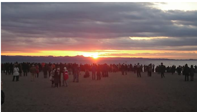
2019年の三浦海岸初日の出