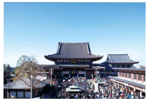
正月の川崎大師平間寺