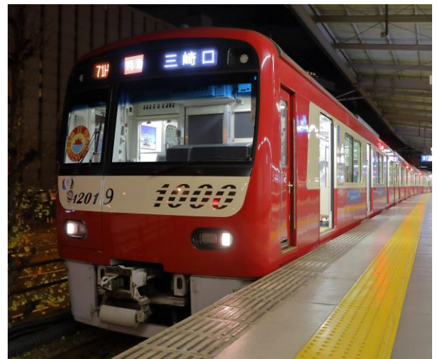
2019年「初日2号」新1000形車両