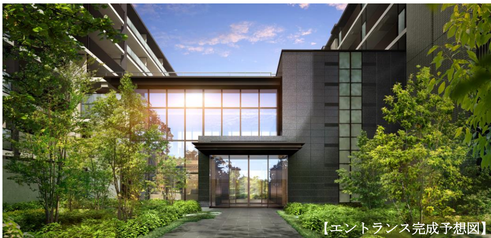
【エントランス完成予想図】