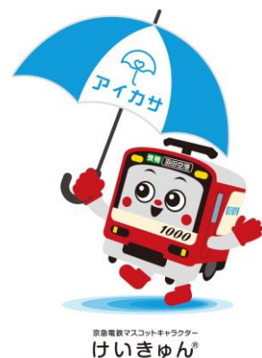
京急電鉄×アイカサ社 ロゴマーク