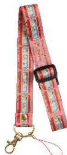
ネックストラップ 650円（税抜）