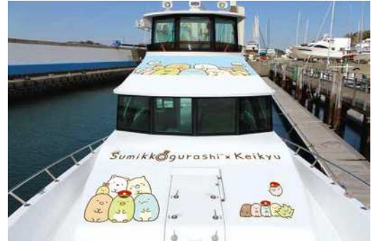
「うみへおさんぽ号」イメージ

葉山マリーナから出航する約45分間の江ノ島・裕次郎灯台周遊クルージングに使用されている「ベイクルーズ葉山Ⅱ」の船体をすみっこぐらしで装飾し、「うみへおさんぽ号」として運航いたします。