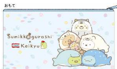
オリジナルペンポーチ イメージ