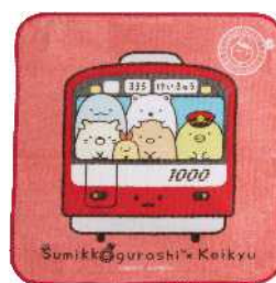
ミニタオル 680円（税抜）