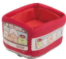
てのりぬいぐるみ（イメージ）つなげてあそべます 980円（税抜）