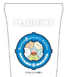
コラボ陶器入りプリンイメージ