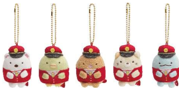
ぶらさげぬいぐるみ（全5種） 各980円（税抜）

URL： http://www.otodokeikyuu-sc.com/ （外部サイトにリンクします。）