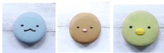
イクミママのどうぶつドーナツ 商品イメージ