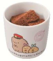
チョコわらびもち 810円（税込）