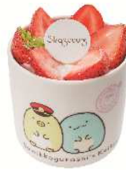
ストロベリーのミニシフォン 810円（税込）