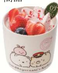
ストロベリーカップショート 1,188円（税込）