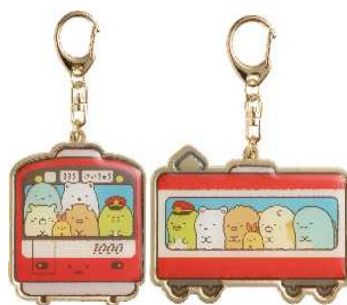
キーホルダー（全2種） 各580円（税抜）