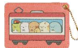
パスケース 1,000円（税抜）