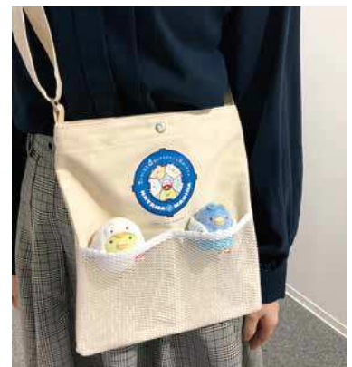
「いつでも一緒にお出かけサコッシュ」イメージ