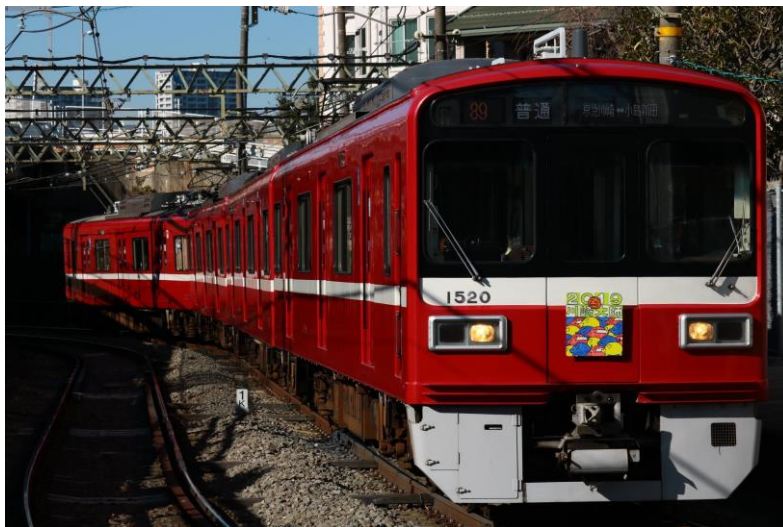
ヘッドマークを付けて運転した2019年の京急大師線