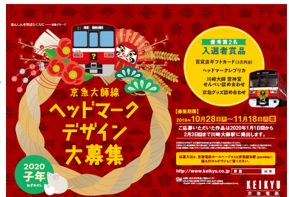
ポスター※イメージ