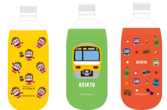
「京急オリジナルペットボトルカバー」