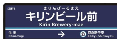
「麒麟ビール前駅」駅名看板

生麦駅1番線に、「麒麟生茶」デザインを施した駅名看板を期間限定で新設し、駅構内においても期間中装飾をしてキャンペーンを盛り上げます。