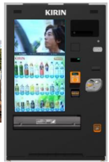
デジタルサイネージ自動販売機