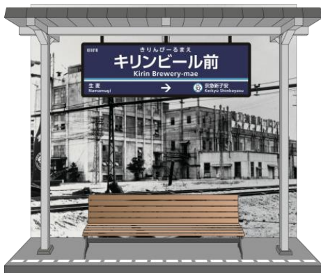
キリンビール横浜工場内フォトスポット