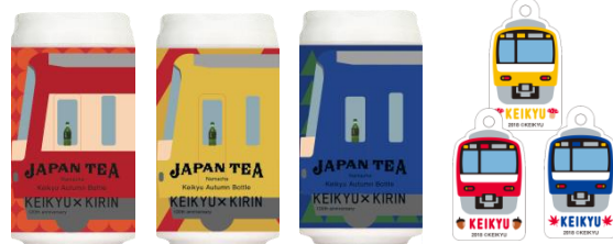
「Keikyu Autumn Bottle（3種類）」