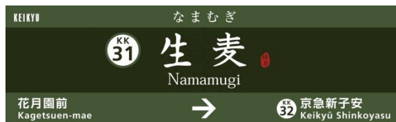
「キリン生茶」デザインの生麦駅 駅名看板