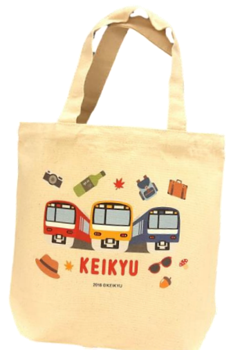
必ずもらえる「KEIKYU トートバッグ」