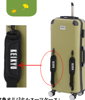
「京急オリジナルスーツケース」

キャンペーン専用ページから登録いただいた交通系ICカード（PASMOまたはSuica等）を使って10本以上ご購入された方に抽選で10名様に「京急オリジナルスーツケース」が当たります。