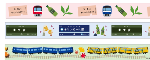
「京急オリジナルマスキングテープ」