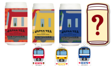
「Keikyu Autumn Bottle」樹脂製 (3種類+当たりボトル)