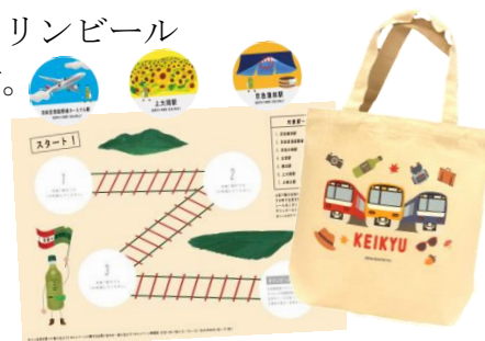
「シール、台紙、KEIKYU トートバッグ」

「麒麟ビール前駅」は、生麦駅～京急新子安駅間にかつて存在していた駅で、戦時中に営業休止、1949年に廃止されました。今回のキャンペーンを記念し、シールラリーのゴール地点でもある麒麟ビール横浜工場内に期間限定のフォトスポットとして設置いたします。