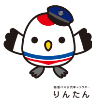
臨港バスバスキャラクター りんたん

※キャラクターの登場は、①11:30~②13:30~③15:30~ 各回30分程度を予定しています。