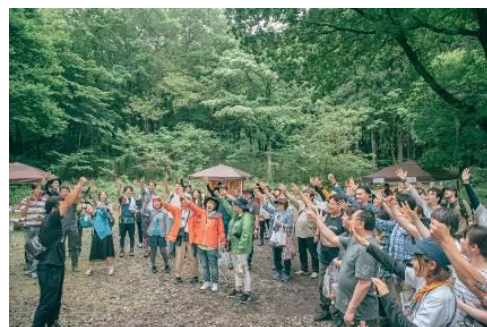
イベントイメージ