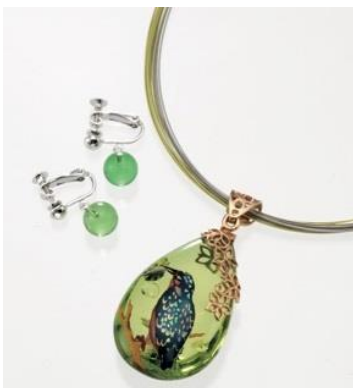
【飯山市/信州うるし工房 彩】 琥珀蒔絵セット「カワセミ」 (イヤリング・ネックレス, カリビアングリーンアンバー) 《現品限り》194,400 円 (税込)