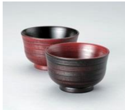
【塩尻市/中村漆器産業】 木製・刷毛目夫婦汁椀 (根来塗・曙塗, 材質: 天然木, 直径 11×高さ 6.7 cm) 《限定 10 点》3,780 円 (税込)