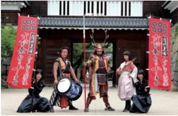
「上田おもてなし武将隊」による演舞披露