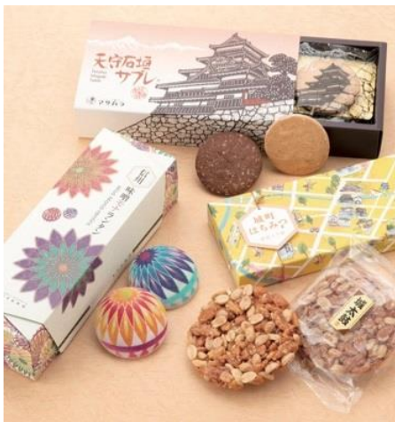
井上百貨店厳選銘産品イメージ

明治創業以来、松本で衣食住のトレンド発信地となってきた井上百貨店が厳選した、地元の銘産品をご紹介します。