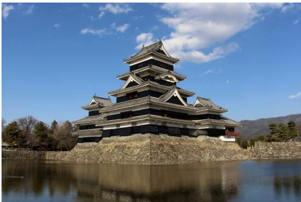
国宝・「松本城」パネル展

戦国時代の永正年間に造られた深志城が始まりで、 現存する五重六階の天守の中で日本最古の国宝の城。