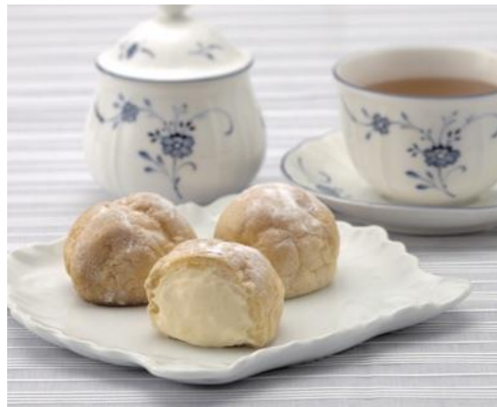
マサムラ/ベビーシュー 《各日限定 50 セット》(10 コ入) 1,242 円 (税込) ※各日 12:00 より販売 ※お一人様 1 セット