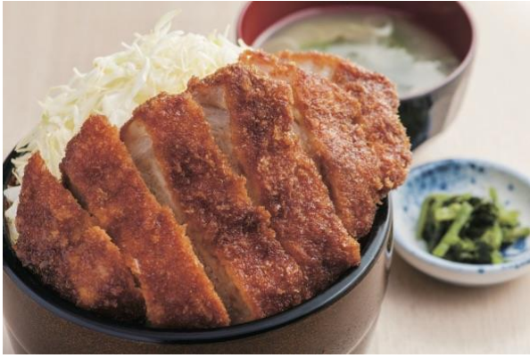
【駒ヶ根市/ソースかつ丼 明治亭】 ソースかつ丼定食 (味噌汁・漬物付) (1人前) 1,404 円 (税込) ※お持ち帰りもごさいます。