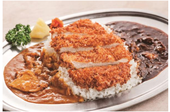
【松本市/洋食屋 おきな堂】 ハヤシとカレーのあいがけカツライス (1人前) 1,296 円 (税込) ※お持ち帰りもごさいます。