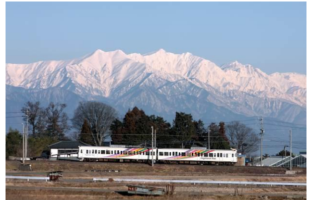
「上高地線電車」路線の旅と観光パネル展

2年後には開業100周年を迎える「上高地線電車」。 路線から見える風光明媚な観光地をパネル展にて紹介。