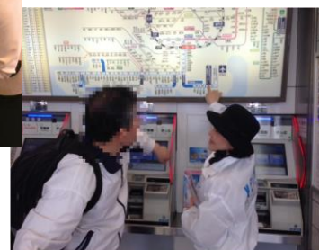
現在の品川駅における対応の様子