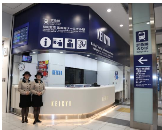
「京急T I C 羽田空港国際線ターミナル駅」