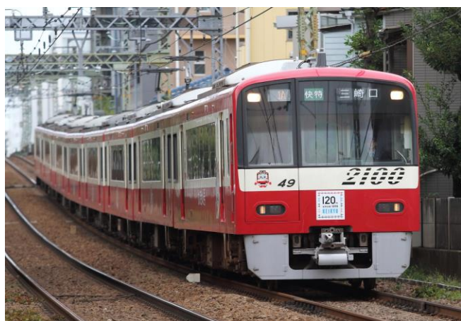
京急2100形「けいきゅん号」