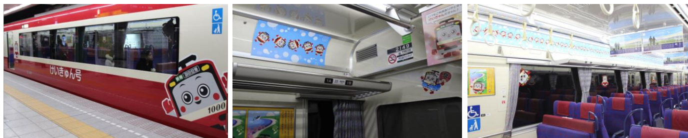
「けいきゅん号」側面

「けいきゅん号」は、クロスシートでおなじみの 2100 形の 1 編成の車体に「けいきゅん」のラッピングを施し、中吊り広告や窓上広告、さらにマナーステッカーや一部の座席のマクラカバーなどもすべて「けいきゅん」のデザインになっており、いたるところに「けいきゅん」がいっぱい電車です。正面には 120 周年マークのヘッドマークをつけて 2018 年 1 月 9 日（火）まで運行しています。