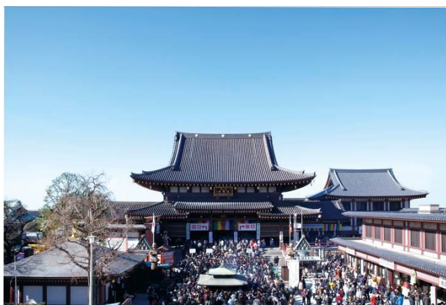
正月の川崎大師平間寺