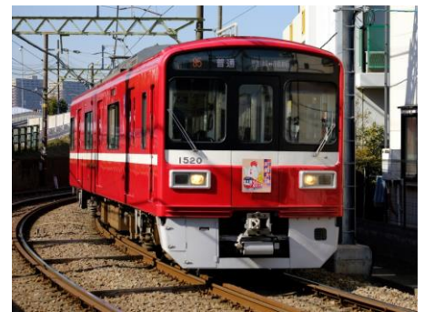
2017年のヘッドマークを付ける大師線1500形車両