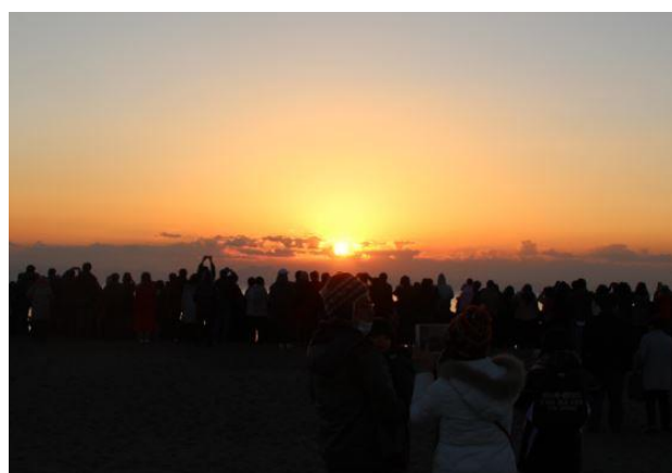
2017年の三浦海岸初日の出