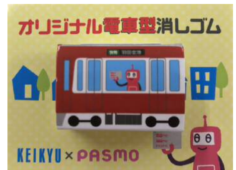
京急電車型消しゴム