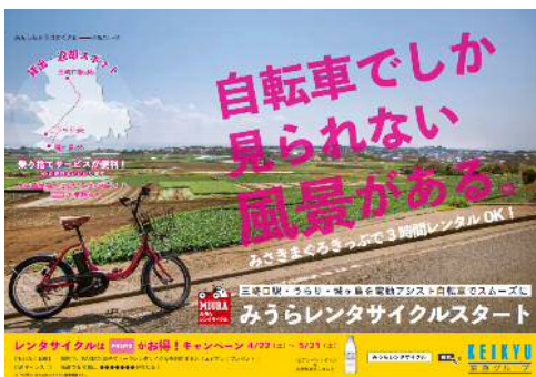
キャンペーンポスター

サービス開始とPASMO電子マネーの取扱開始を記念して、 4月22日（土）から5月21日（日）まで、「レンタサイクルはPASMOがおトク！キャンペーン」を実施します。 期間中は、PASMO電子マネーを使用してレンタサイクルをご利用いただくと京急電車型消しゴム付き「エビアン」ペットボトル1本をプレゼントするほか、Wチャンスとして抽選で6名様に、「三崎まぐろ詰め合わせセット」をプレゼントいたします。詳細は別紙をご覧ください。