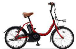
電動アシスト自転車(イメージ)