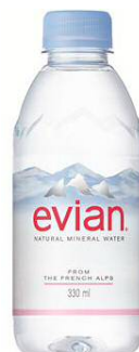
「エビアン」ペットボトル（330ml）