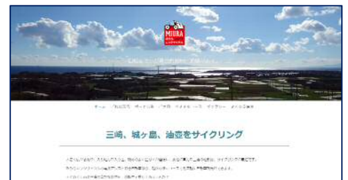
みうらレンタサイクル WEBサイト