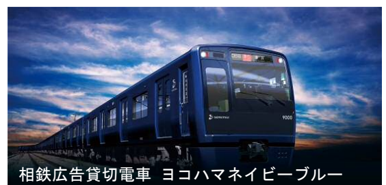
相鉄広告貸切電車 ヨコハマネイビブルー

→ 横浜駅を起終点とする、よこはまフェア「里山ガーデン」(旭区)など鉄道バス周遊を提案