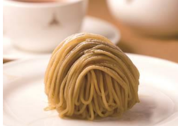
【桜井甘精堂】(栗の木テラス)

信州御膳(ざるそばと山菜天ぷら, 信州地鶏の<各日限定500コ お1人様4個まで> 炊き込みご飯, 漬物) <各日限定50膳> (1人前) 1,600円(税込)