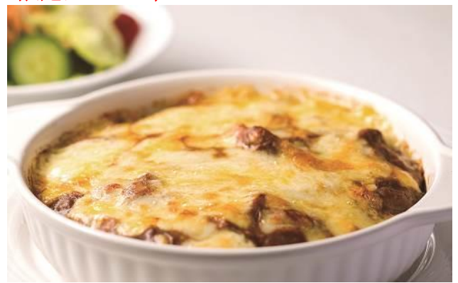
<イートイン>幻の地鶏「真田丸」を使用したチーズ工房 が生み出す絶品メニュー

安養寺のみそを使用した濃厚なスープに八幡屋磯五郎の七味唐辛子で味付けした挽肉をトッピングした会場内オリジナルメニューです。上田市にある【麵匠 佐蔵 F U B U K I】濃厚魚介豚骨味噌らーめんもご用意しています。