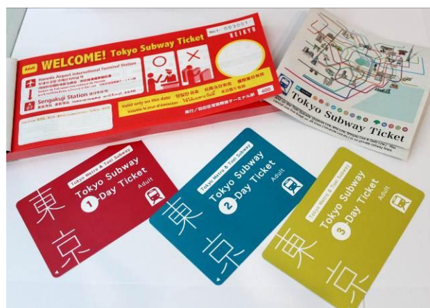
WELCOME! Tokyo Subway Ticket