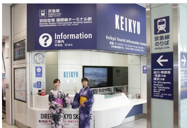
羽田空港国際線ターミナル駅 京急ツーリストインフォメーションセンター(京急TIC)

京急電鉄では、より多くの訪日外国人のお客さまに対して、今後もサービスの拡充を図ってまいります。