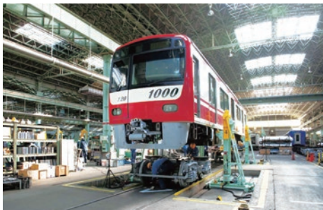
鉄道車両全般にわたる事業を幅広く展開

卓越した技術で信頼の品質を創造する輸送用機器修理業では、鉄道・自動車等の車両更新・保守、販売業務を柱とした事業を推進。また、駅構内や事務所の備品製造取付など、積極的に取り組んでいます。今後お客さま第一主義を掲げ、様々な側面から地域社会に貢献していきます。