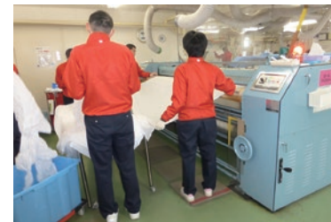
クリーニング工場での作業風景

2017年6月現在、障がい者の雇用の促進などに関する法律に基づいた京急グループの関係会社特例認定会社は、京急電鉄と京急ウィズを含め21社で、障がい者雇用率は2.24%となりました。