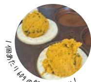
「飽きたら100gの餡がぎゅっしり！」

2015年に、「高梨農園」の直売所として開店。ジャムやドレッシングなどは季節限定品、ほかにもこだわりが詰まった手仕事の品を販売する。