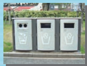
山下公園 ゴミ箱サイン