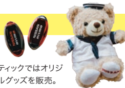
ブティックではオリジナルグッズを販売。

て、国内外で愛された名車や日産が目指すエコロジーな未来を体験するタイムトラベルへ。