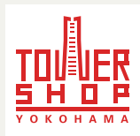
タワーショップ ロゴマーク (横浜ランドマーク タワー 69F)