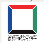
横浜市民ギャラリー ロゴマーク