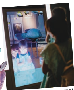
画面の前に立つと、あら不思議!