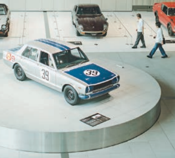
上／「GT-R」50周年記念展示。展示は時期によって異なる。右／日産が開発した100%モーター駆動エンジン「e-POWER」の仕組みを4DVRで体感中。