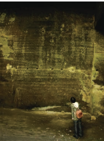
池子石の石切場跡の俳句が刻まれた壁面。