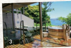
3. ホテル京急油壺観潮荘の露天風呂。 4. 三崎のまぐろを使った昼食。