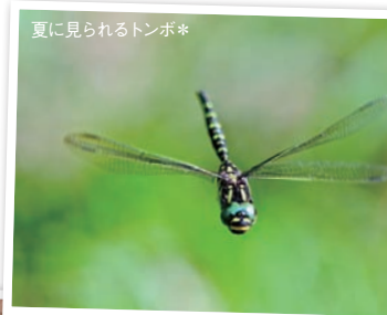
夏に見られるトンボ*