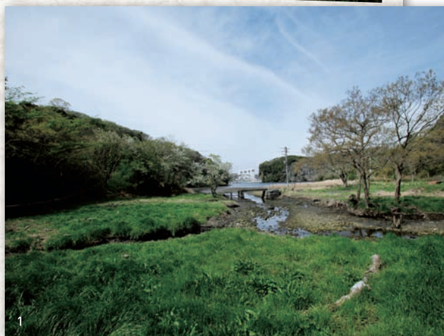
1・2. 小網代の森と湿地。

季節。チョウや、トンボ、アカテガニをはじめとするカニたち、野鳥たちに満ちています。自然の中でいのちのパワーをシャワーのように浴びて、身も心もリフレッシュしませんか？ 帰りには、ホテル京急油壺観潮荘で日帰り入浴と、三崎のまぐろを使った昼食をお楽しみいただきます。