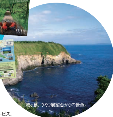
城ヶ島、ウミウ展望台からの景色。