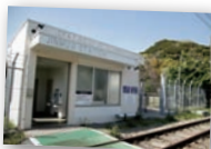
神武寺駅には米軍専用改札口がある。