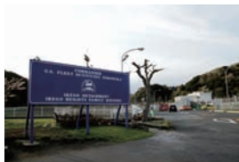
奥には池子の森自然公園がある。