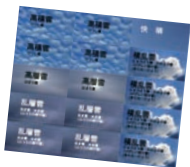
理科ハウスのショップでお土産に買った、雲観察用の「もくもくカレンダーシール」。

駅に向かうと、線路の向こうには英語の看板が。神武寺駅の西側は 在日米海軍施設 ◇で、昨年その一部の共同使用が始まり、今年2月には池子の森自然公園が開園して、誰もが利用できるようになった。そして線路沿いに日米交流の一環として飾られた、 日米の子どもたちが描いた「未来の絵」 ◇を見ながら駅に戻り、帰路についた。ハイキングだけでなく、石切場跡、科学など、さまざまな出会いがあつた一日となつた。