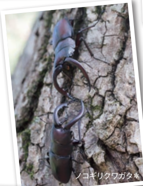
ノコギリクワガタ*