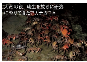
大潮の夜、幼生を放ちに干潟に降りてきたアカテガニ*