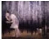
世界中の子と友達になれる(2002年)

新進気鋭の日本画家、松井冬子。その独特の美意識で描かれた画布には、人間存在の力強さと優さがたゆたい、観る者を惹きつけて離さない魅力があります。