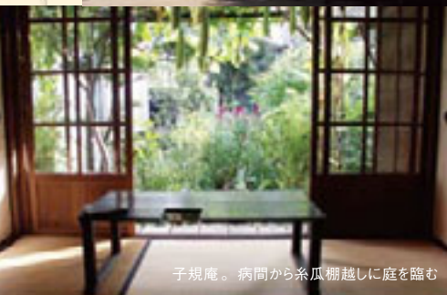
子規庵。病間から糸瓜棚越しに庭を臨む