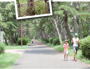
京浜運河に並行するようにのびる一直線の道で、対岸にはモノレールが走行する。