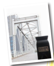
「天王洲ふれあい橋」はライトアップも。

「天王洲銀河劇場」にて10月3日(木)15日(火)公演予定の「それからのフレンチ」。