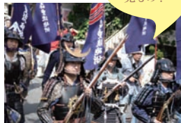
演目の最後、一斉射撃は見もの!

パレードにも参加しつつ、荏原神社の鎮守橋にて2回行われる。鉄砲隊による火縄銃の射撃は、空砲が響き渡り迫力満点。