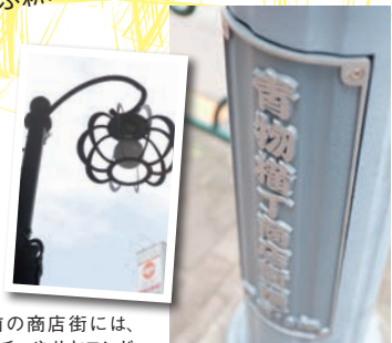
駅前の商店街には、カボチャやサヤエンドウを象ったユニークな街灯が並ぶ。