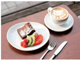
「ENOTRIA Diana」 のガトーショコラ 500円とカプチー ノ600円。