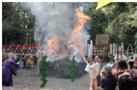
不動明王の智慧の火で、ご本尊のご加護を…

弘法大師・空海の開山の品川寺にて江戸時代から続く神事。修行者は、祈念した護摩札を捧持して火の中で願いを祈る。