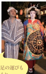
特殊な足の運びも見ておくれ～

28日(土)に行われる前夜祭。おいらん4人と新道、かむろ、若衆らが花街として栄えた品川宿(ハツ山口～北品川二丁目会館)を歩く。