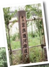
1975年に開園した「京浜運河緑道公園」。