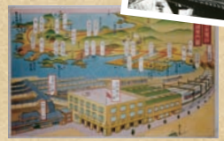
1933(昭和8)年、品川～浦賀間直通転開始時の沿線案内図。