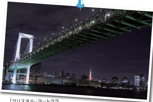
「クリスタル・ヨットクラブ」のクルージング。

「ふれあい橋」に到着。「ホテルノヒカリ」をはじめ数々のドラマや映画のロケ地になった歩行者専用の橋だ。江戸末期に造られた台場の石を石垣に利用するなど、歴史的な一面も。橋からあたりを見回すと、おしゃれなテラス席のある「ENOTRIA Diana」を発見。さっそく注文してちよつと休憩。バルやヨーロッパの食堂風の店内で、昼時はお肉料理やパスタランチを目当てに、近隣のオフィスワーカーでにぎわい、約40種のイタリアワインも楽しめる。陽気なスタッフが淹れてくれたカプチーノには、クマのラテ