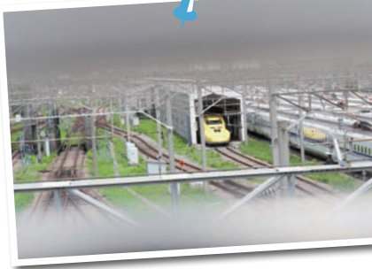
「大井車両基地」内で休むドクターイエロー。正式名は「新幹線電気軌道総合試験車」で軌道や電気設備の点検のための専用車。

系はもちろん、希少なドクター イエローの姿も！ 隊長から 減多に見られないと聞いてい ただけに、いきなり出合えて ラッキー！ 隣の敷地に貨物 列車の車庫も見つけて興奮は さらにUP。私は鉄子!?!と自 らの新たな二面に気づいたとこ