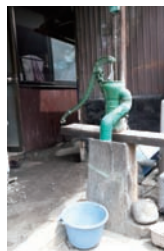
店舗裏の井戸。すぐ近くに稲荷神社も。

創業 230 余年経つ今も、日に 6～8 枚の畳を仕上げる店主は 7 代目。社寺の多いこの地で厚い信頼を得ている名畳店だ。築約 100 年の現家屋は昔、店先が海だったため、中 2 階建ての珍しい造り。