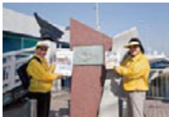
六郷橋には1868年(明治元年)の明治天皇渡御の際に建てられた舟橋の記念碑が。

て多摩川沿いの六郷橋へ。ここはかつて東海道から続く「 六郷の渡し 」があつた場所。「江戸時代には徳川家康が架けた六郷大橋があつたのですが、1688(元禄元)年に大洪水で流されたあ