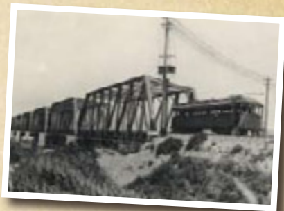
1911(明治44)年に開通した六郷川鉄橋。港町駅は、1929(昭和4)年に臨時営業した「河川事務所前」とほぼ同位置に開業。