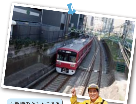
六郷橋のたもとにある「旧・六郷橋駅」跡は知る人ぞ知るスポット!

て多摩川沿いの六郷橋へ。ここはかつて東海道から続く「 六郷の渡し 」があつた場所。「江戸時代には徳川家康が架けた六郷大橋があつたのですが、1688(元禄元)年に大洪水で流されたあ