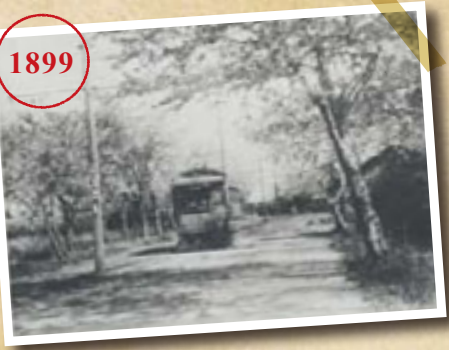
六郷橋から大師に至る桜並木を走る、大師電気鉄道(現在の京急電鉄)の電車。創業当時の1899(明治32)年、路面電車として走っていた。

「日本コロムビアといえば地元の象徴でした。今は、その跡地にタワーマンションの建設がはじまり、新しい象徴ができるのが楽しみです」と語るの は蘆屋駅長。「港町は人情味にあふれる街で、夜遅くまで勤務のときには、駅前のご近所さんからおかずの差し入れをいただくこともあるんですよ。」