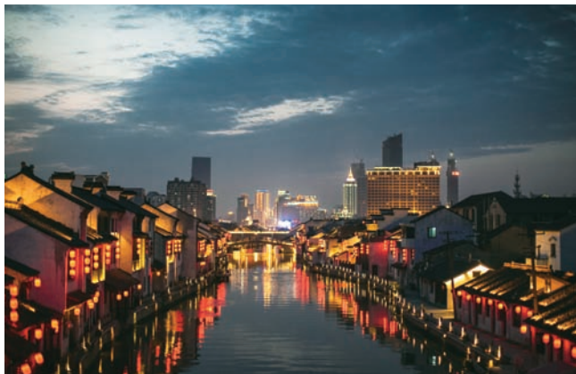
2014年に登録された、中国の8つの省を貫く「中国大運河」。写真は無錫運河。