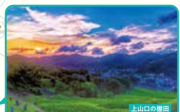
のどかな畑田の風景に癒やされます♪